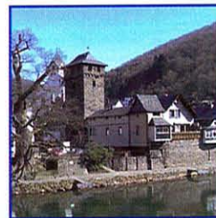
Historische Lahnfront in Dausenau