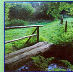
Überquerung des Oberbachs bei Zimmerschied