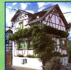
Fachwerkhause in Hömberg