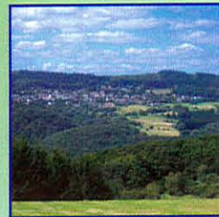
Ausblick auf Kemmenau