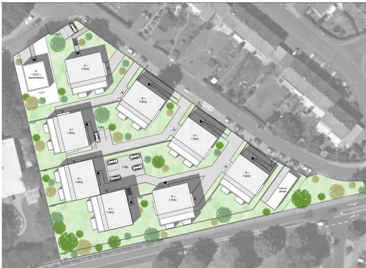
Bebauungskonzept – unmaßstäblich

a) Ziel der Stadt Montabaur ist es, aufgrund der nach wie vor bestehenden Nachfrage nach Wohnraum die bauplanungsrechtlichen Voraussetzungen für eine sich einfügende und angemessene Nachverdichtung in einem zumindest teilweise durch Reihenhaus- und Mehrfamilienhausbebauung mitgeprägten Quartier zu schaffen. Damit soll auch der Planungsleitlinie „Innen- vor Außenentwicklung“ Rechnung getragen werden.