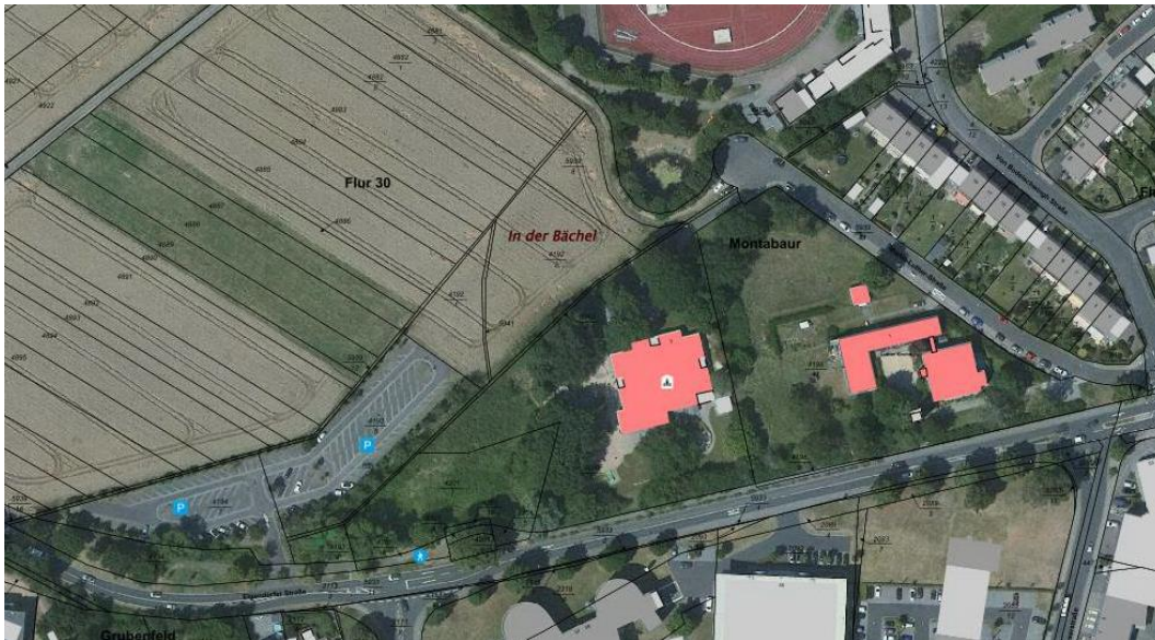
Luftbild – unmaßstäblich

2.2 Damit werden alle vorgefundenen bzw. geplanten Nutzungen insgesamt planerisch und städtebaulich geordnet und für die geplanten ergänzenden Verwendungszwecke Baurecht geschaffen.