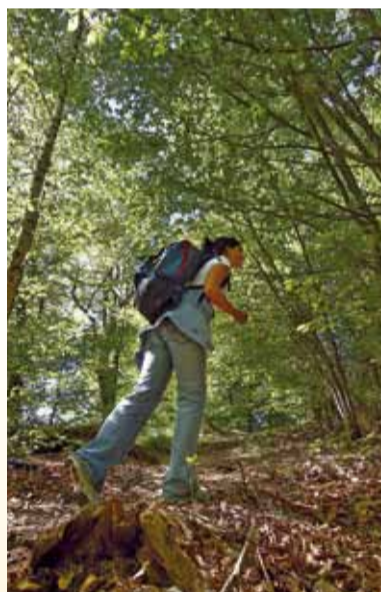
Wandern im Gelbachtal

Der Startschuss ist gefallen. In Zukunft geht die Verbandsgemeinde mit einem eigenen Tourismuskonzept auf die Jagd nach Erholungssuchenden und Urlaubern. Und im Gegensatz zu Mallorca punktet Montabaur mit zentraler Lage und guter Erreichbarkeit per Bahn und Auto.