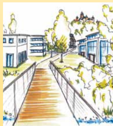
Zukunftsvisionen im Aubachviertel.

Großen Wert wird auf eine ausgewogene Beziehung zwischen Natur, Historie und modernen Siedlungsbau gelegt. Der historische Bahnhof als auch das Stellwerkhäuschen bleiben erhalten und geben dem Quartier einen besonderen Charakter. (Fortsetzung auf Seite 2)