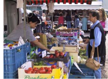
Der Weihnachtsmarkt ist in der Adventszeit stimmungsvoller Treffpunkt für die ganze Region

Ein hochwertiges Waren- und Sortimentsangebot sowie die fachkundige Beratung – das sind die starken Seiten des innerstädtischen Einzelhandels in Montabaur. Gute Parkmöglichkeiten direkt an der Fußgängerzone runden den gelungenen Einkaufsbummel ab.