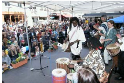
Ein buntes Veranstaltungsprogramm garantiert Einkaufserlebnisse für die ganze Familie...