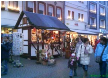
Der Wochenmarkt – donnerstags und samstags in Montabaur